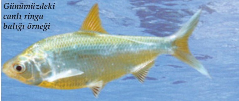
Günümüzdeki canlı ringa balığı örneği