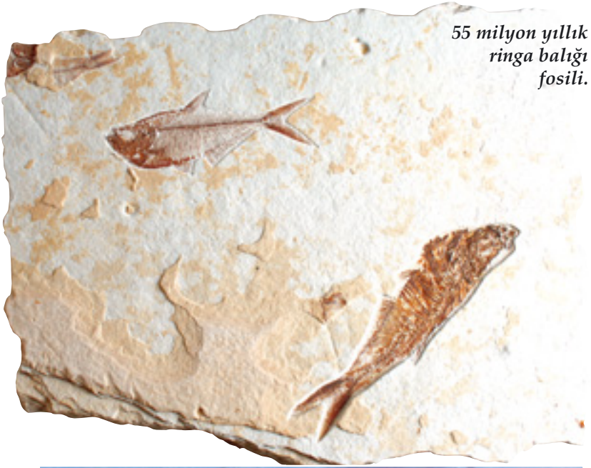
55 milyon yıllık ringa balığı fosili.

Fosiller evrimcilerin canlıların birbirlerinden tuedikleri, aşama aşama geliştikleri iddialarını yerle bir etmektedir. En altta günümüzde yaşayan bir ringa balığı görülmektedir, üstündeki resimde ise yan yana fosilleşmiş iki ayrı ringa türü görülmektedir. Tüm detaylarıyla fosilleşmiş olan bu balıklar, canlıların yaratıldığının delili niteliğindedir.