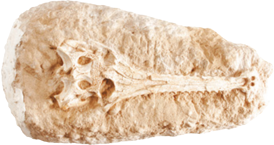
Timsah Kafatası Dönem: Senozoik zaman, Eosen dönemi Yaş: 54 - 37 milyon yıl Bölge: Kuzey Afrika